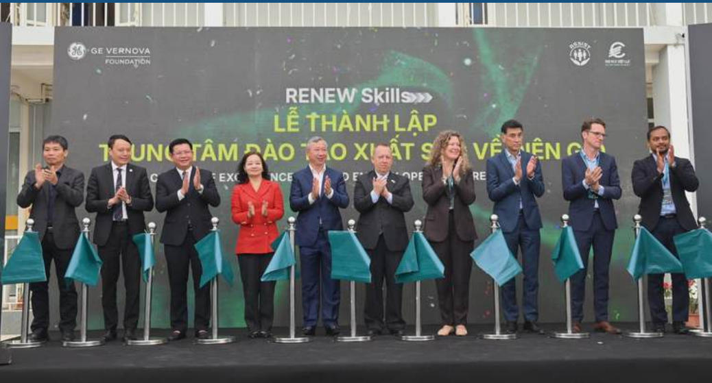
Các đại biểu thực hiện nghi lễ thành lập Trung tâm đào tạo xuất sắc về điện gió tại Trường Đại học Điện lực.

Sáng ngày 11/3/2026, tại Trường Đại học Điện lực diễn ra lễ thành lập Trung tâm đào tạo xuất sắc về điện gió. Sự kiện là một trong những kết quả quan trọng của Dự án Phát triển Kỹ năng RENEW Skills do GE Vernova Foundation tài trợ, với sự phối hợp triển khai của Asia Society for Social Improvement and Sustainable Transformation (ASSIST).