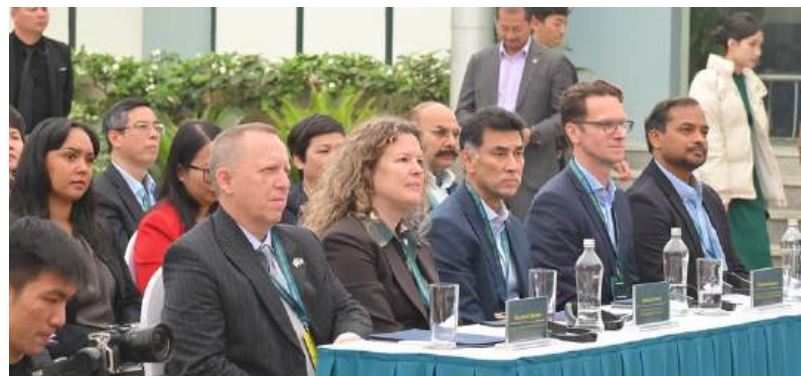
Các đại biểu tham dự chương trình.

Sáng 26/3/2026, Thành ủy Hà Nội tổ chức hội nghị nghiên cứu, quán triệt Nghị quyết số 02-NQ/TW ngày 17-3-2026 của Bộ Chính trị về "Xây dựng và phát triển Thủ đô Hà Nội trong kỷ nguyên mới" và triển khai Chương trình hành động của Ban Thường vụ Thành ủy thực hiện Nghị quyết của Bộ Chính trị.